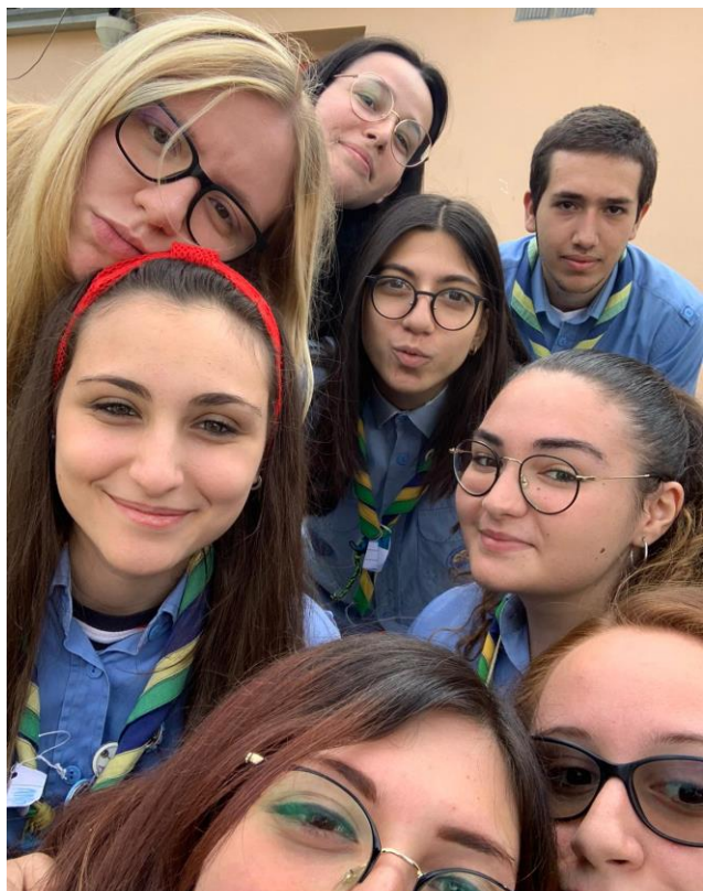
San Stelle Del Sud

Finalmente dopo tutti questi mesi siamo riusciti a incontrarci e passare del tempo insieme, il nostro augurio è quello di non passare più così tanto tempo separati.